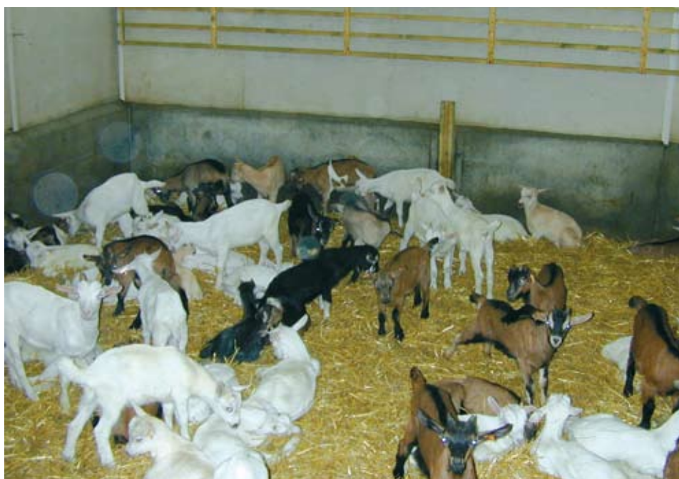
Que faut-il mettre en place dès les naissances pour obtenir des lots de chevrettes en bonne santé comme celui-ci ?

Il est conseillé d'éviter les trop grands lots (moins de 50 chevreaux), cela permet de limiter la compétitivité entre les animaux et les risques de contagion. Une densité de 3 chevreaux par m 2 est la recommandation usuelle. Un trop grand nombre de tétines à disposition peut s'avérer néfaste car les animaux en utilisent préférentiellement certaines et le lait stagne dans les autres (recommandation : 3 tétines par case). La distribution au seau est à proscrire car les animaux «boivent» et ne têtent pas ce qui entraîne des problèmes de digestion.