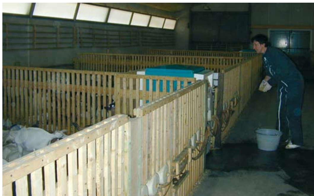
Un nettoyage quotidien des machines d'allaitement et des cases limite les risques de diarrhées

Dans les premières heures le chevreau semble saoul puis la faiblesse extrême empêche l'animal de se déplacer et il finit par en mourir.