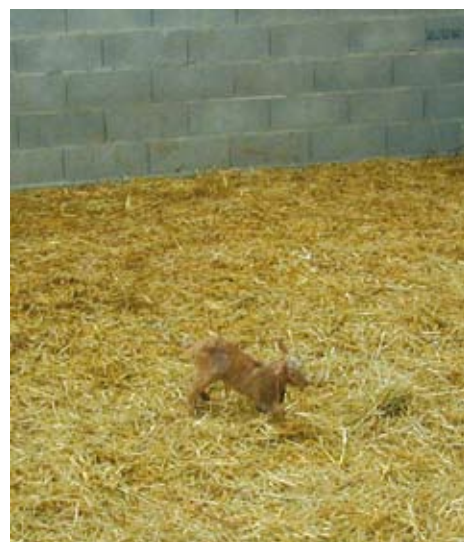
A la naissance, le chevreau est fragile. Un environnement sain est essentiel à sa survie